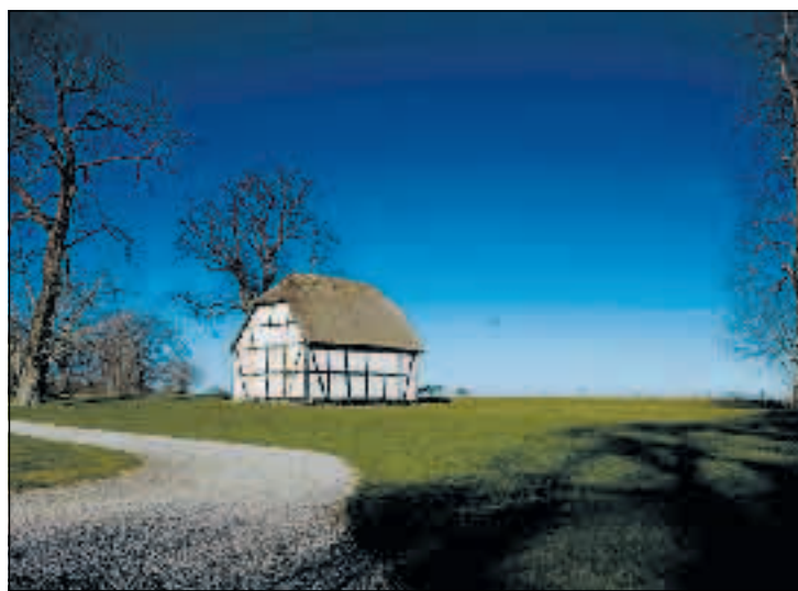
Det gamle brændeskur ligger frit med udsigt til de åbne vidder.