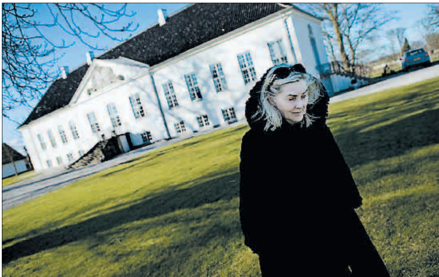
Turebyholm blev opført af Adam Gottlob Moltke i 1754, så han havde et standsmæssigt sted at drikke the, når han havde besøg af kongen, Frederik V.