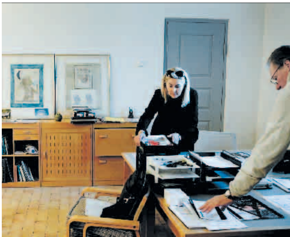
Det er primært i slottets kælderetage, at husets erhvervsaktiviteter foregår. Her er der indrettet kontorlokaler.