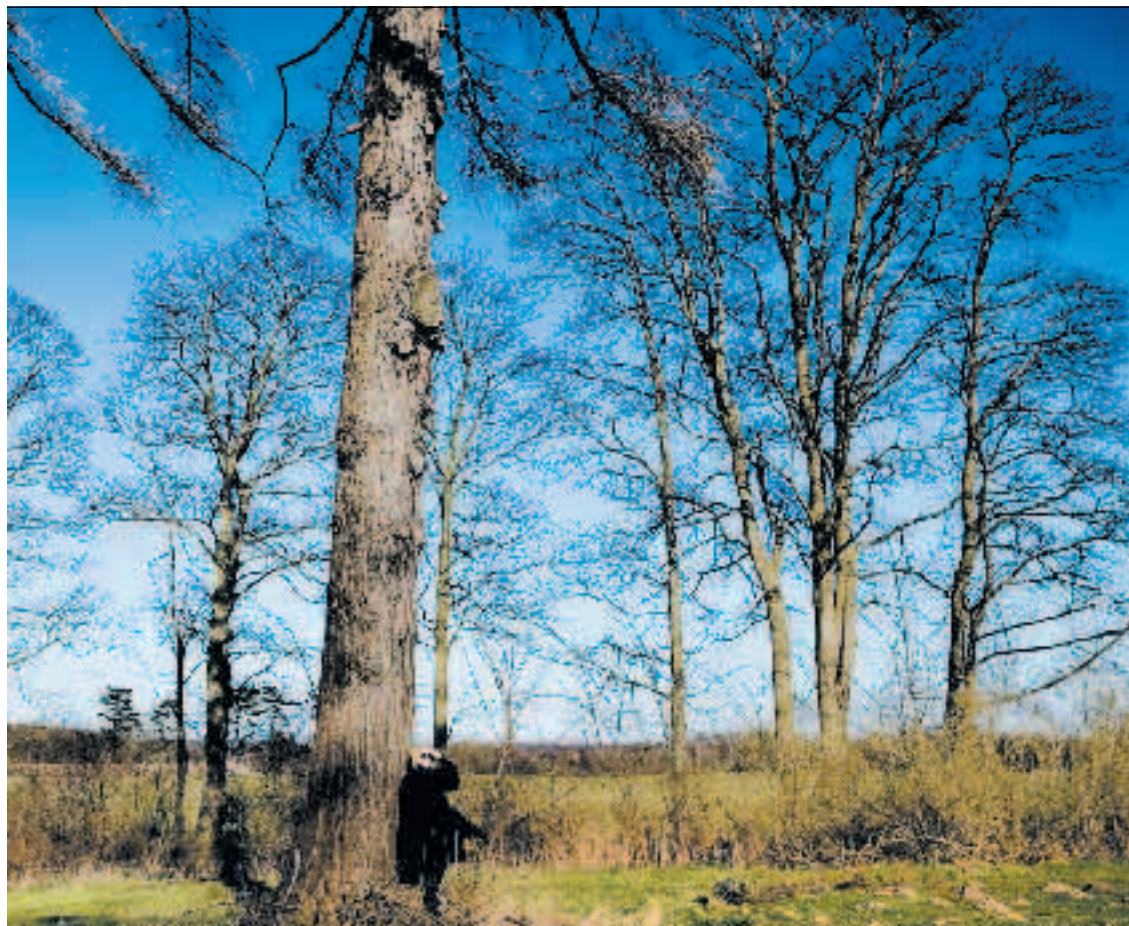
Slottet ligger frit i landskabet omgivet af skov til alle sider.

Han har tegnestue i Hillerød, men har tidligere været ansat i Slots- og Ejendomsstyrelsen.